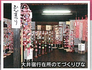
大井宿行在所のでづくりびな

※雨天の場合はコースを変更させていただく場合がございます。また、事前に悪天候が予想される場合はツアーを中止させていただく場合もありますのでご了承ください。 ※写真はすべてイメージです。 ※表示価格は税込です。