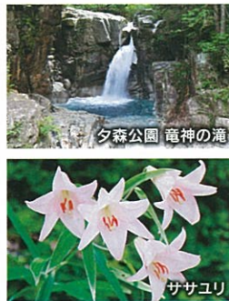
夕森公園 竜神の滝

えなてらす = ササユリ(大井・坂本など) 9:30発 = 明治座 = ササユリ(坂下) = 夕森公園 = えなてらす 16:00頃