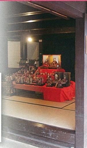
岩村城下町のひなまつり